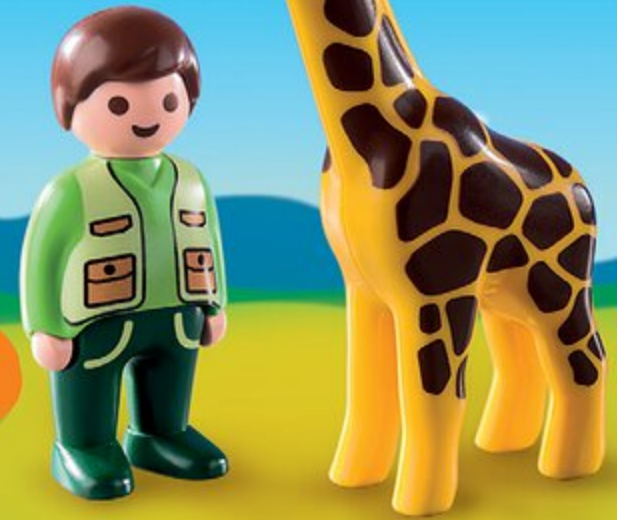
9380 Soigneur avec girafe