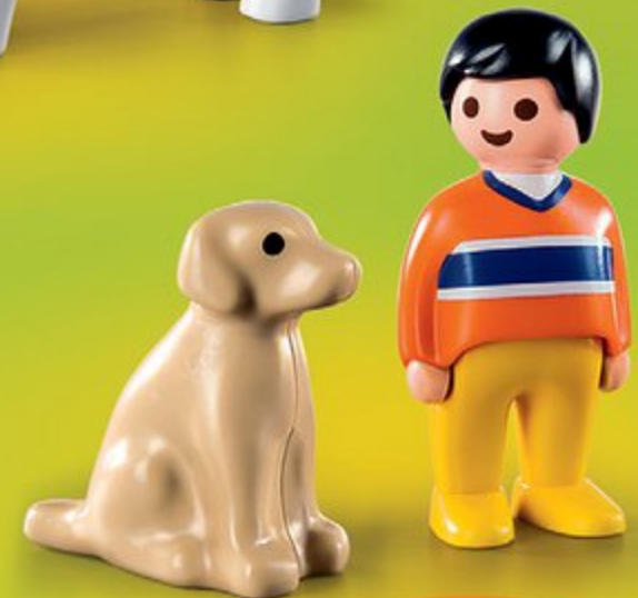
9256 Garçon avec chien