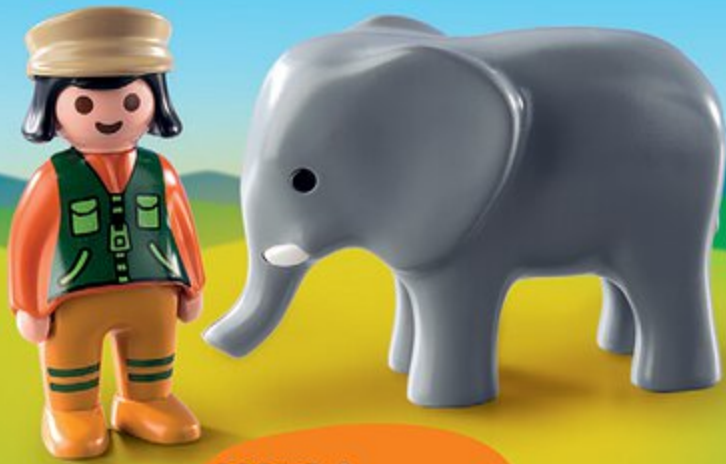
9381 Soigneuse avec éléphanton

Des personnages avec des animaux, le kit parfait pour commencer avec PLAYMOBIL 1.2.3