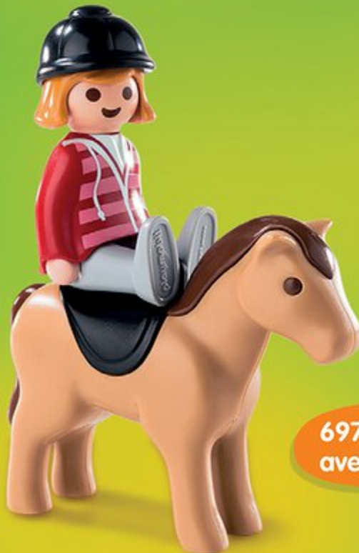
6973 Cavalière avec cheval