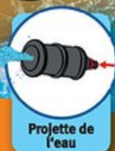
Projecteur de l'eau