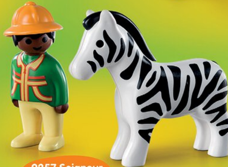
9257 Soigneur avec zèbre