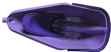
1 coque RainCan avec poignée retractable intégrée