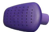
1 pomme d'arrosage