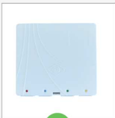
Prise terminale optique 4 fibres

⚠ Aucun branchement ne doit s'effectuer avec la prise murale téléphonique dans le cadre d'une installation fibre optique Bouygues télécom. ⚠