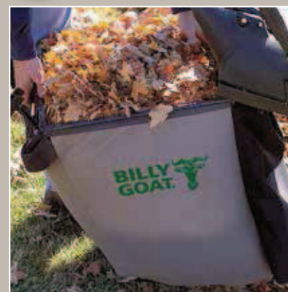
Sac toile pour herbe et feuilles

La structure composée d'un plastique polyéthylène très robuste permet de supporter toutes les contraintes de nettoyage. Le sac synthétique composé de polyester offre une bonne résistance à l'humidité et son dessous coqué lui permet de se déplacer sur des surfaces irrégulières.