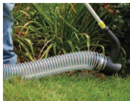
Tuyau flexible de 2,30 mètres