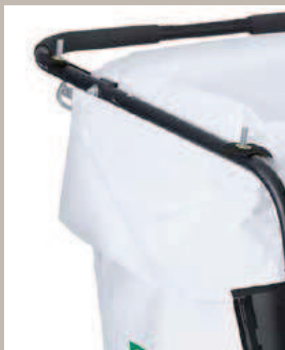
Sac aspirateur feutre poussière