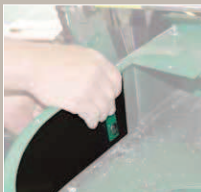
Kit renfort de carter