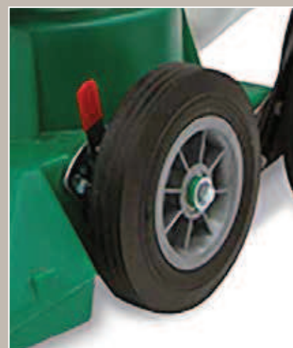
Roues ajustables en hauteur