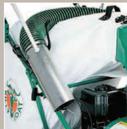
Tuyau aspiration en option