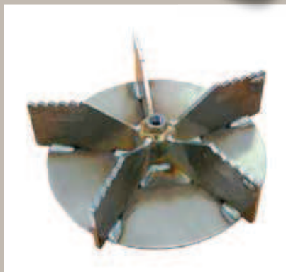
Hélice moteur renforcée