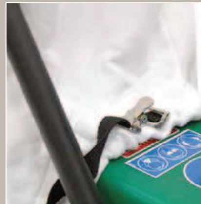
Sac d'un volume de 104 litres